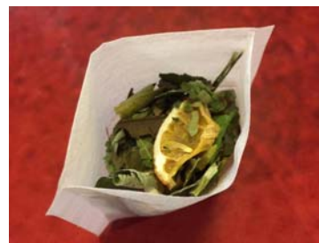
お茶パックに手詰め