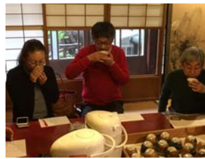
香りと味と。正しい入れ方を知ってから入れるとまろやかで甘い。