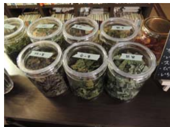
里山資源の山野草