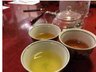
左上から紅茶、棒茶、緑茶（玉露は写真なし）