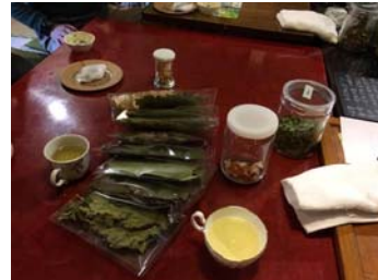
元の形で乾燥した状態のサンプル