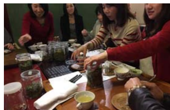
実際に飲んでいただきながら 香りや効能を元に配分を指南中